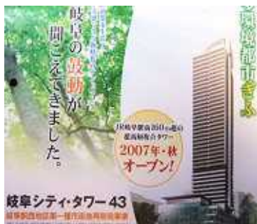
2007 / シティタワー43