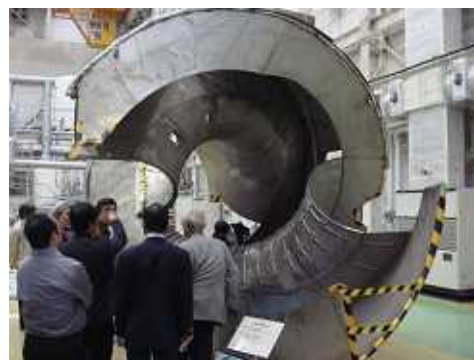
2008 / 核融合技術研究所